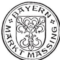
Christian Thiel 1. Bürgermeister

Bekanntmachungshinweis: 13.02.2026 – 27.02.2026